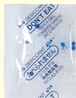
シリカゲル SP タイプ

シリカゲルを大きくしただけでは、防湿効果に限度があり、商品の見栄えにも影響を及ぼすことがあります。