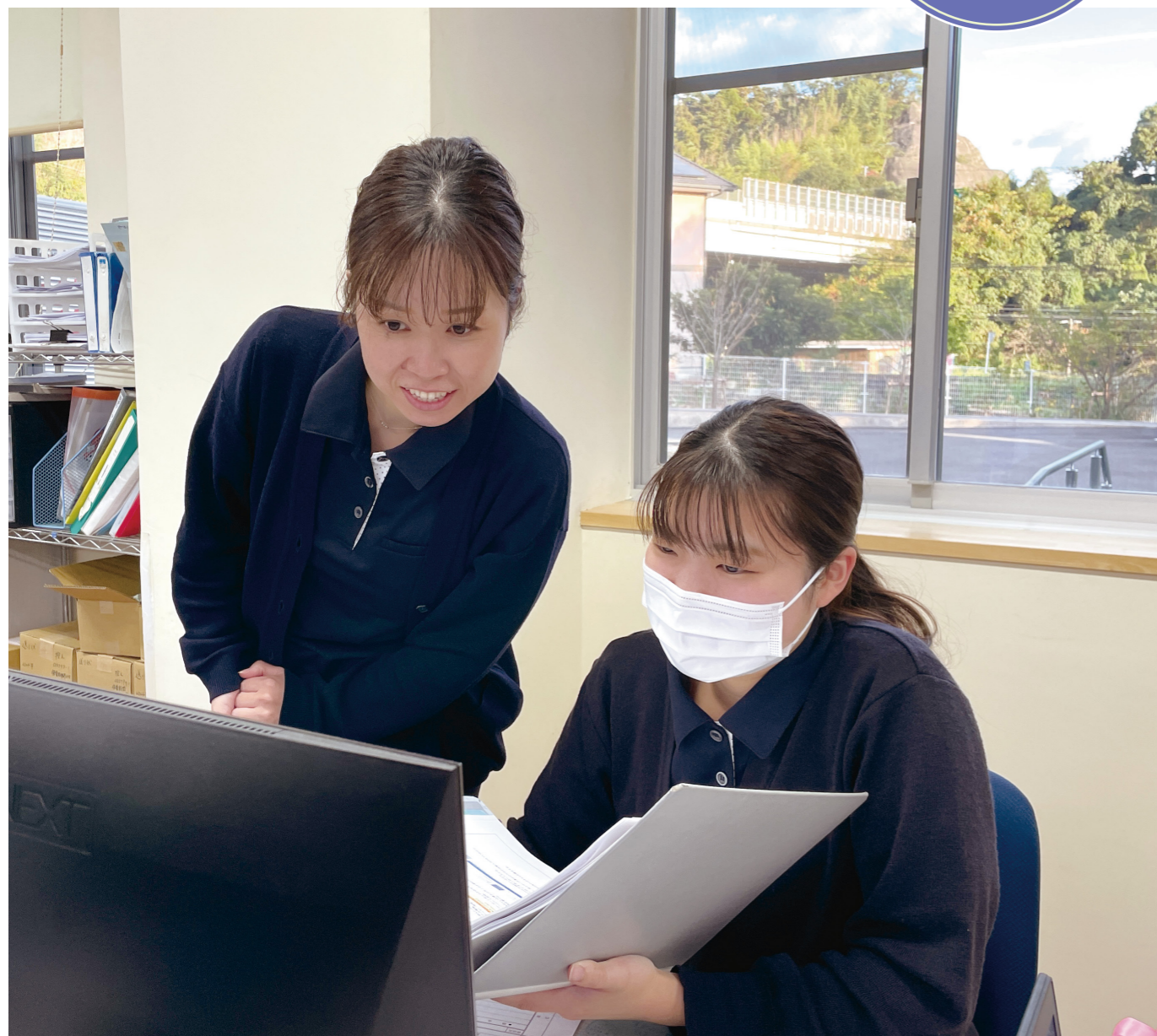
今号から、鳥繁産業で働いている仲間たちの思いや様子をお伝えしてまいります。まずは、販売管理課の受注チームから紹介します。