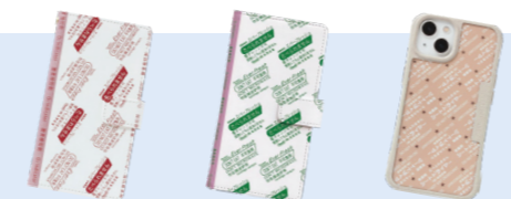
エパーフレッシュ レッド エパーフレッシュ グリーン シートドライヤー

鳥繁産業のオリジナルスマホケース「食べられませんシリーズ」を作りました。「えっ、そのスマホケースなに？面白いね」と会話が始まるのがうれしいです。ぜひ、オンラインショップを覗いてみてください。